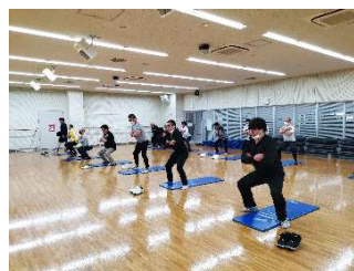
生活習慣病改善プロジェクト「健幸くらす」