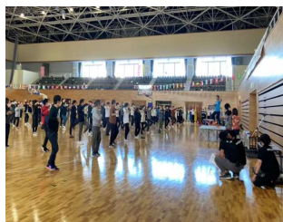
オータムフェスタと測定ブース