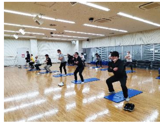
生活習慣病改善プロジェクト「健幸くらす」