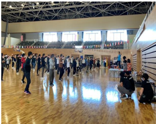
オータムフェスタと測定ブース